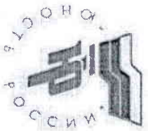
Таблица итоговых результатов Республиканской стартакиады преподавателей и сотрудников профессиональных образовательных организаций Удмуртской Республики

Дата – 10 -12 января 2018 год Место проведения: с.Сигаево, БПОУ УР «Сарапульский политехнический колледж»